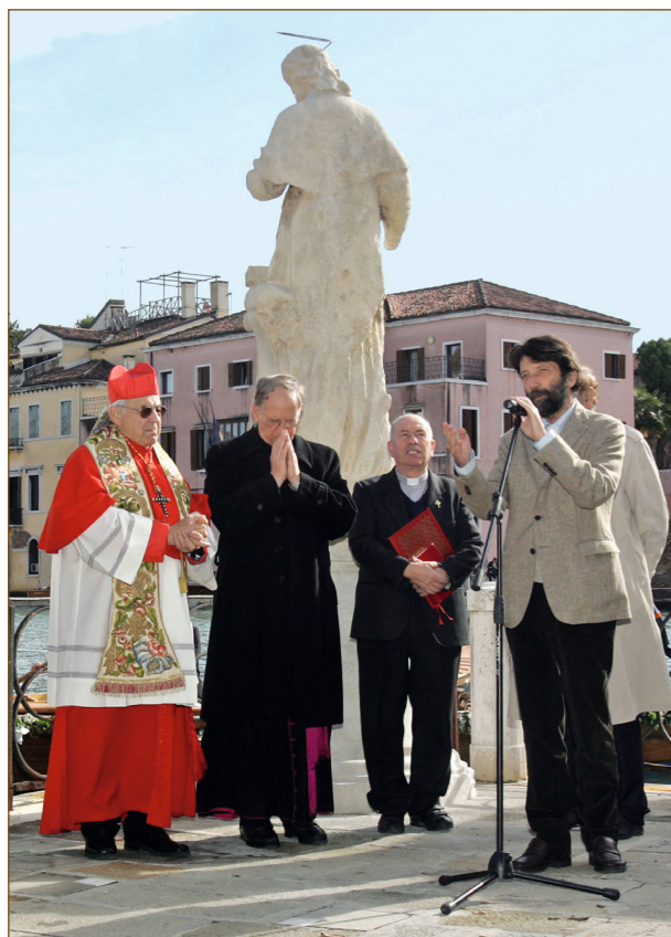
V roce 2009 sochu sv. Jana Nepomuckého na břehu Canal Grande požehnal kardinál Miloslav Vlk.

Bissona Praga je dlouhodobý mnohgenerační projekt, který bude „fungovat“ i v daleké budoucnosti. Životnost této lodě bude obrovská, jelikož bude uchovávána na suchu, v hale benátské loděnice Arsenale. Kromě cest do Prahy bude dok opouštět pravděpodobně jen na Regatu Storicu.