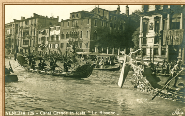
Bissony při vodní slavnosti Regata Storica na Canal Grande.

Historická regata – Regata Storica je jedna z nejdůležitějších a nejstarších benátských slavností organizovaná tamní radnicí. Její historie sahá do poloviny 13. století. Po téměř sedm století se každým rokem Benátčané scházejí, aby změřili při závodu lodí síly se svými sousedy i přespolními veslaři. Na regatu se sjíždějí desetitisíce návštěvníků z celého světa. Akce je veřejná a má nekomerční charakter.