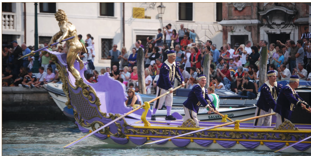
Desítky tisíc lidí obdivují každým rokem při benátské regatě starobylé lodě i umění veslařů.