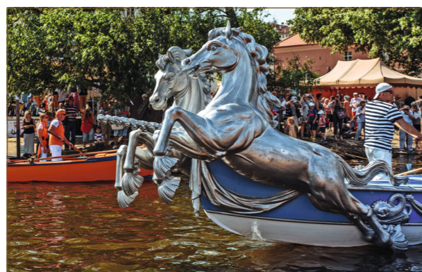
Benátské lodě bisone při slavnostech NAVALIS v Praze v květnu 2018.