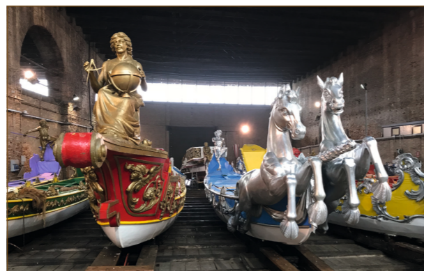
Lodě v hale benátské loděnice Arsenale.