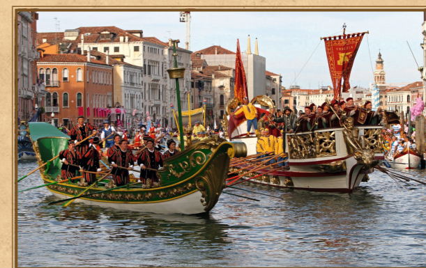
Přehlídka Regata Storica je velkolepou podívanou dodnes.