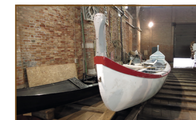
Trup válečné lodi čeká na sochařskou výzdobu v benátském přístavišti Arsenale.