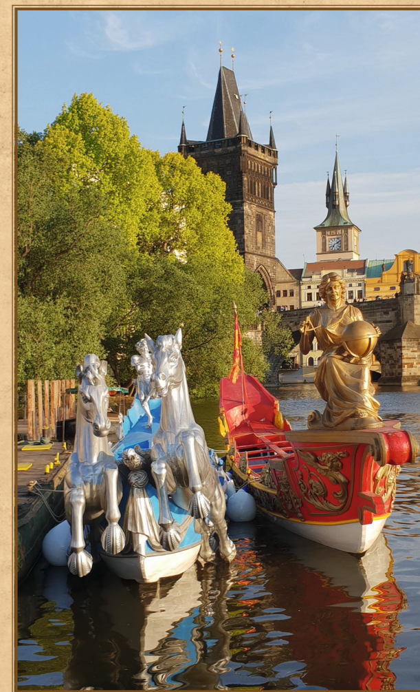
Benátské lodě Cavalli a Geographia v roce 2018 na pražských slavnostech NAVALIS.

Jako jediným se nám podařilo v roce 2018 dostat za hranice domovského města Benátek dvě lodě typu bissona (Geographia, Cavalli), ty se staly hlavní ozdobou programu desátého jubilejního ročníku Svatojánských slavností NAVALIS 2018. Lodě po dobu slavností přitahovaly pozornost široké veřejnosti, odborníků i médií. Bissona Praga po svém uvedení v Benátkách v září 2019 bude nedílnou součástí Svatojánských slavností NAVALIS 2020.